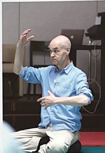
Aufmerksame ZuhörerIn bei einer Demonstration von Nick Pole in seinem Workshop zu Sprache des Traumas