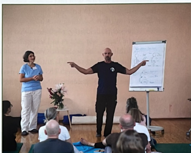
Eindrücke zum Trauma Summit in Wien