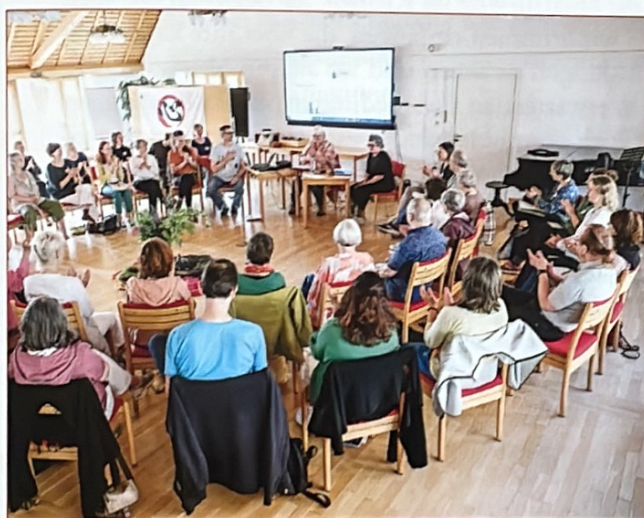
Berichte vom Fachtag der GSD